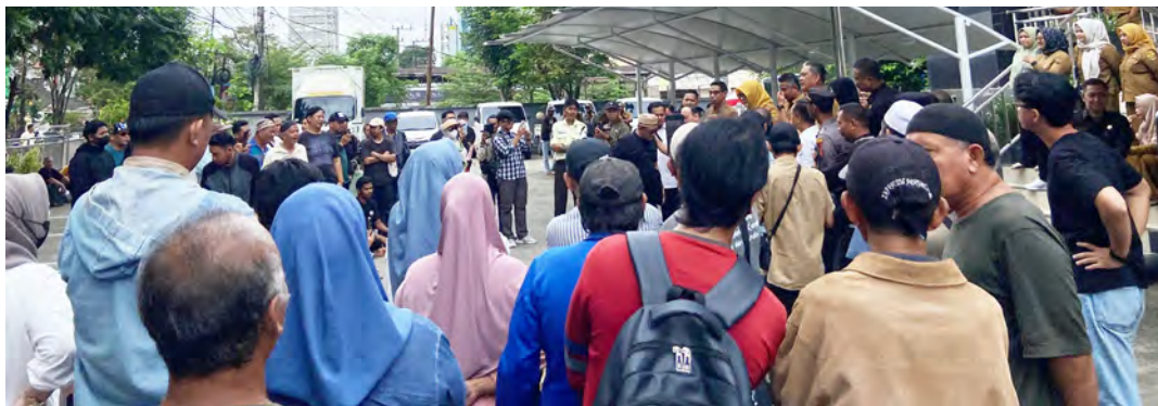
PEDAGANG Pasar Pagi saat lakukan protes di Kantor Disdag Samarinda.