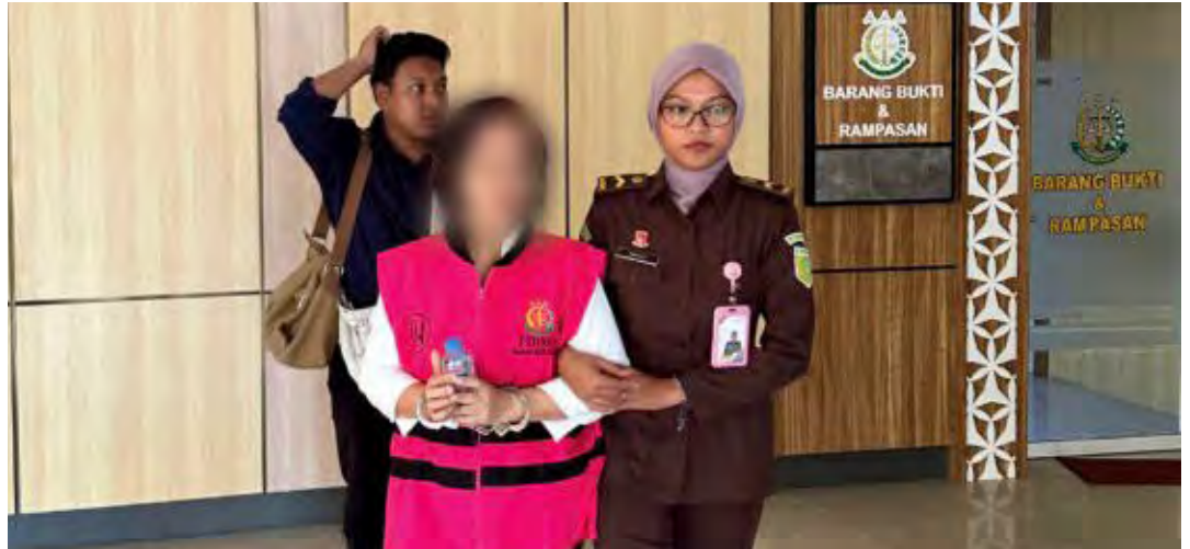
SALAH satu tersangka saat ditahan oleh Kejari Balikpapan.