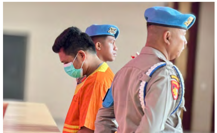
TERSANGKA pencurian di lapak pedagang yang telah diamankan oleh Satreskrim Polresta Balikpapan.