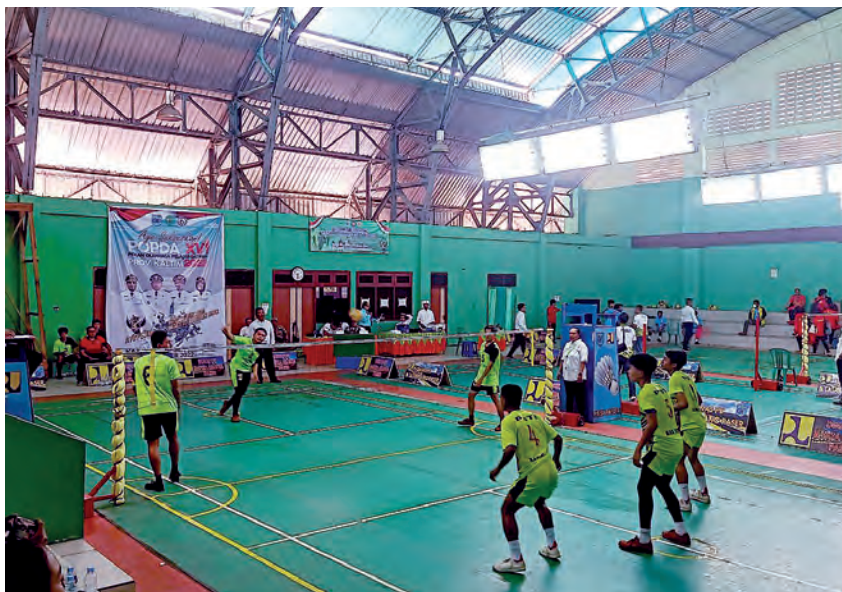
BERAU targetkan menjadi juara umum pada Porprov 2026 mendatang.

Pemerintah Kabupaten (Pemkab) Berau akan terus berkomitmen mendukung pengembangan olahraga dan pembinaan atlet secara berkelanjutan. Bupati juga berpesan kepada seluruh atlet yang tengah dipersiapkan menuju Porprov Kaltim 2026, agar terus berlatih dengan disiplin dan menjaga semangat juang. "Teruslah berlatih dan berjuang. Kami dari Pemkab Berau akan berupaya memberikan dukungan terbaik agar target Porprov 2026 dapat tercapai," pungkasnya. (RIZAL)