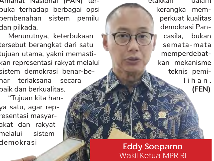
Eddy Soeparno Wakil Ketua MPR RI