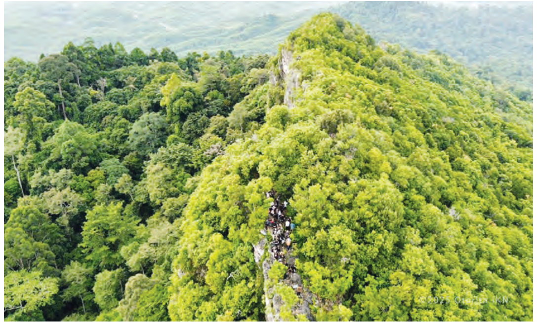
LEBIH dari 50 peserta dari berbagai daerah mengikuti tur pendakian Gunung Parung di kawasan Sepaku, Nusantara.

Inisiatif ini merupakan bagian dari program strategis Otorita IKN bertajuk *The Living Museum Story: Voices of