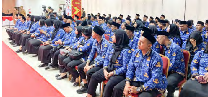
PPPK paruh waktu di lingkup Pemprov Kaltara dilantik, Selasa (23/12/2025).