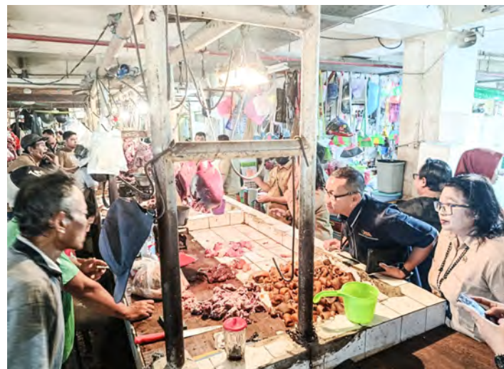
BAPANAS melakukan pemantauan pasokan dan harga bahan pangan penting menjelang perayaan Natal dan Tahun Baru 2026.

Kenaikan harga telur terjadi hampir di berbagai daerah di Indonesia. Peningkatan permintaan menjelang Nataru, khususnya untuk kebutuhan rumah tangga dan pembuatan kue, menjadi fak-