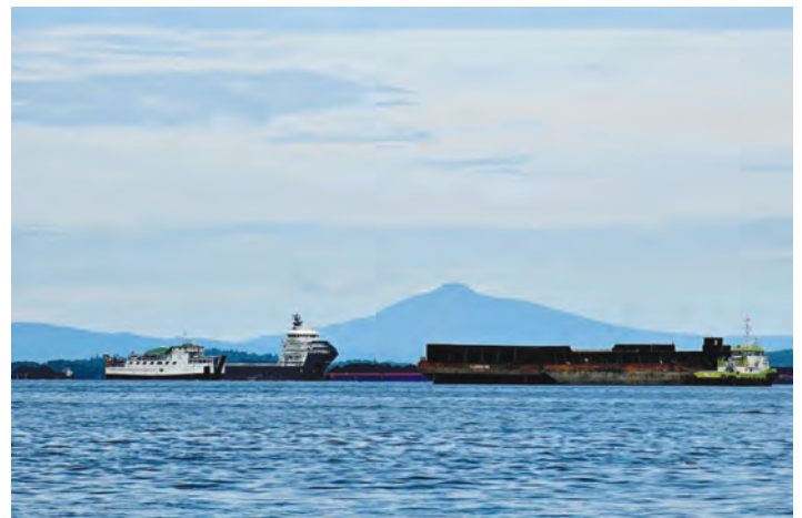
GUNUNG Parung terlihat dari teluk Balikpapan.